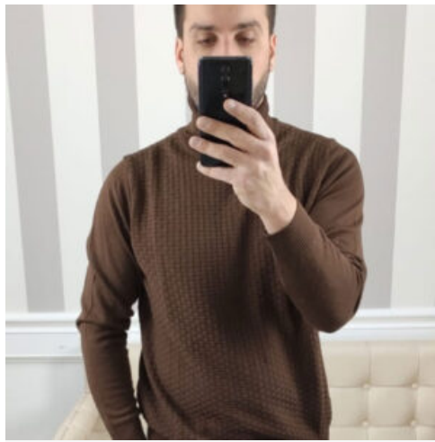
MAGLIA UOMO DOLCEVITA - RIF. AB021