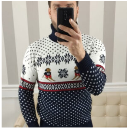
MAGLIA UOMO DOLCEVITA - RIF. AB022