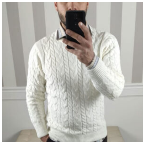
MAGLIONE UOMO OVER-D - RIF. AA967