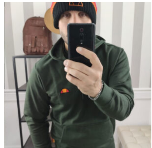
FELPA UOMO CON CAPPuccio ELLESSE - RIF. AA950