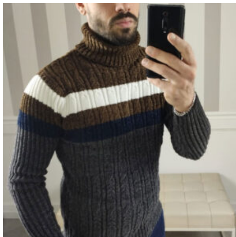
MAGLIA UOMO DOLCEVITA - RIF. AA960