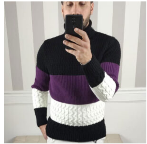
MAGLIA UOMO - RIF. AA971