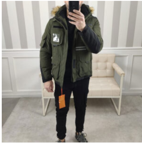
GIUBBINO UOMO CON CAPPUCCIO - RIF. AB018