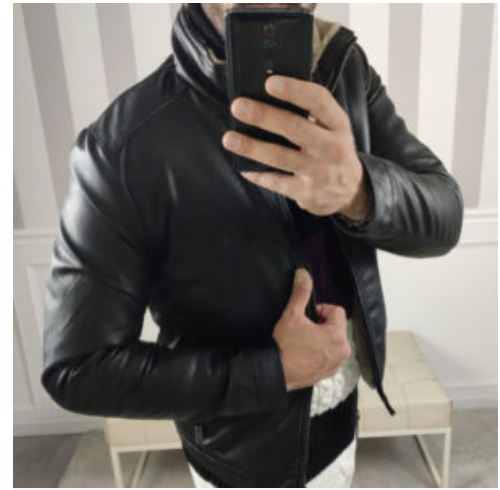
GIUBBOTTO UOMO OVER-D - RIF. AA970