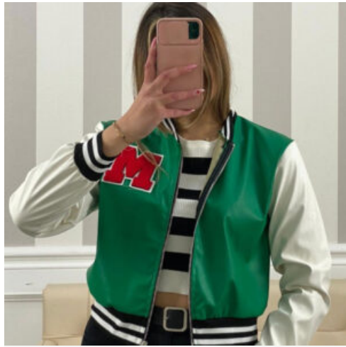
GIUBBINO DONNA - RIF. AB078