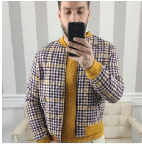
GIUBBINO UOMO - RIF. AB005