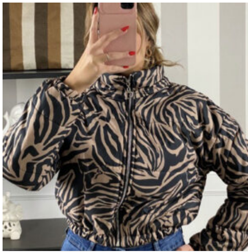
GIUBBINO DONNA - RIF. AA931