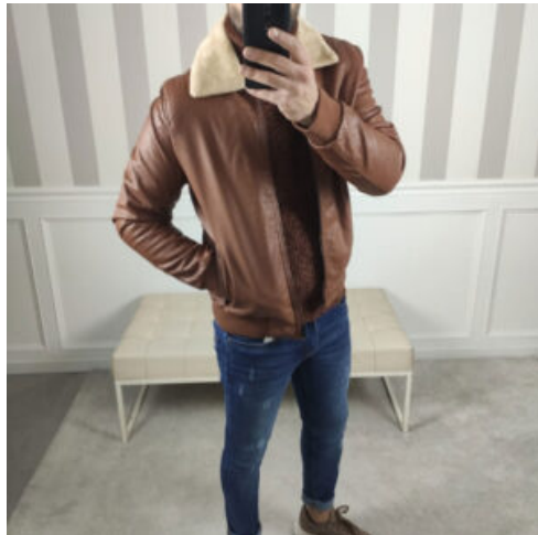
GIUBBINO UOMO - RIF. AA964