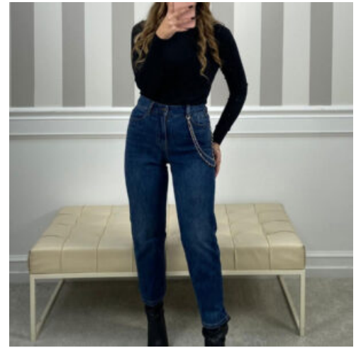
JEANS DONNA - RIF. AB002