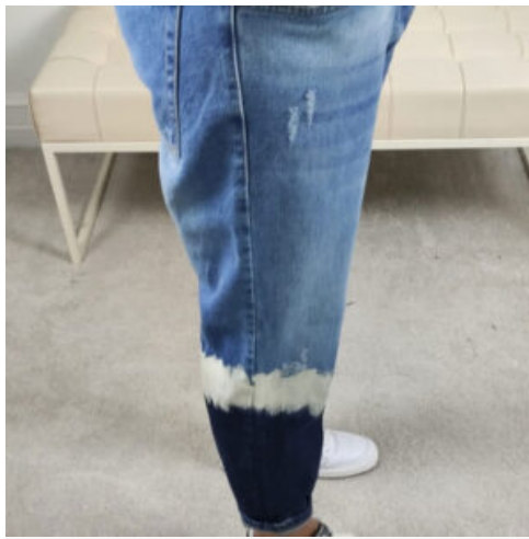
JEANS UOMO - RIF. AA972