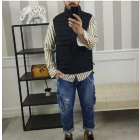
JEANS CARGO UOMO - RIF. AA883