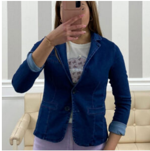
GIACCA DONNA - RIF. AB082