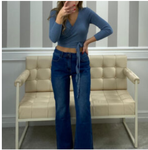
JEANS DONNA - RIF. AB012