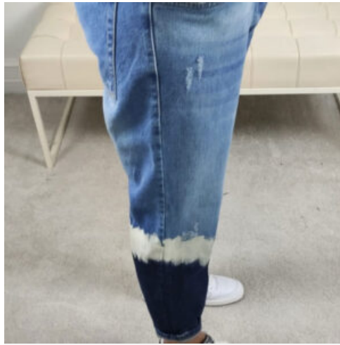
JEANS UOMO - RIF. AA972