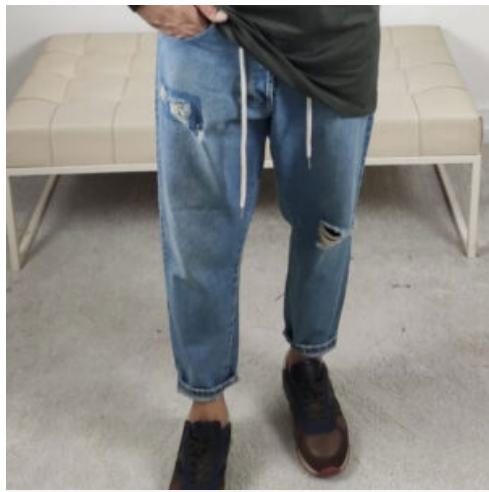
JEANS UOMO CON STRAPPI - RIF. AA974