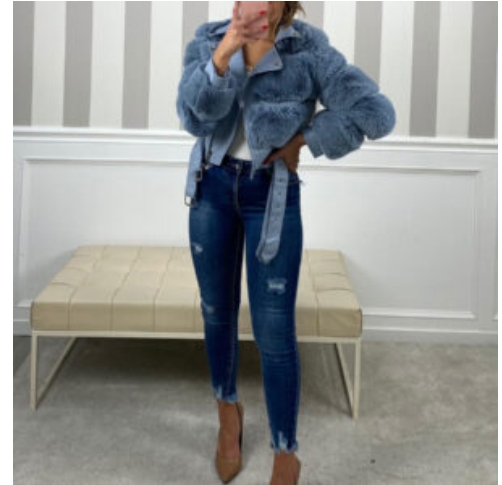
JEANS DONNA SKINNY - RIF. AA957