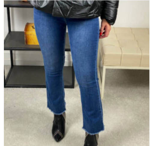
JEANS DONNA - RIF. AA915