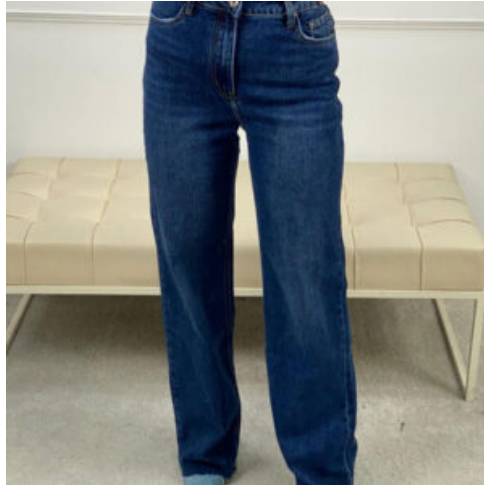
JEANS DONNA - RIF. AA978