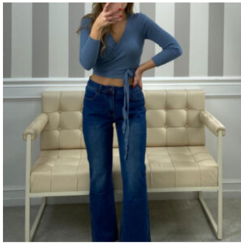
JEANS DONNA - RIF. AB012