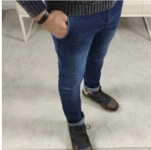
JEANS UOMO - RIF. AA961