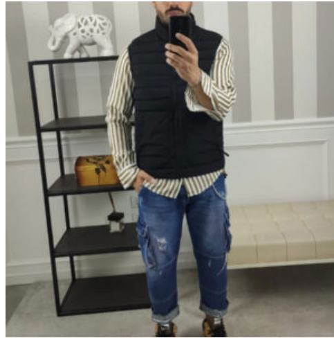
JEANS CARGO UOMO - RIF. AA883