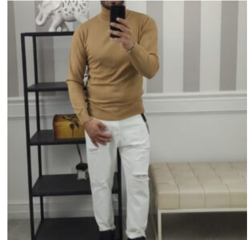
JEANS UOMO - RIF. AA891