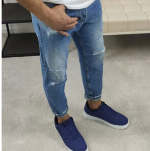
JEANS UOMO - RIF. AA894