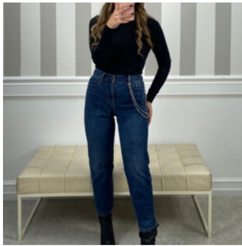
JEANS DONNA - RIF. AB002