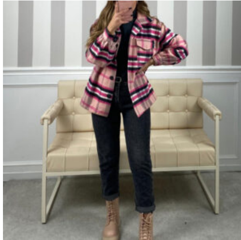
JEANS DONNA - RIF. AA999