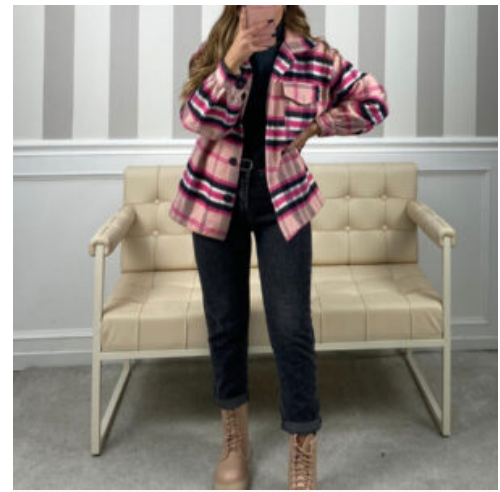
JEANS DONNA - RIF. AA999