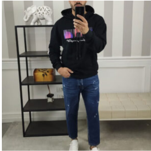
JEANS UOMO - RIF. AA889