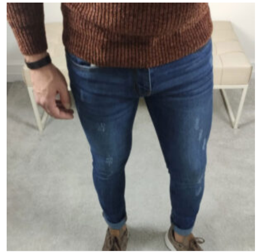
JEANS UOMO - RIF. AA965