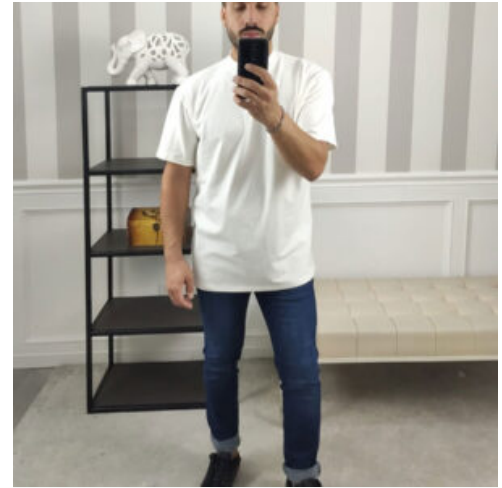
JEANS UOMO - RIF. AA875