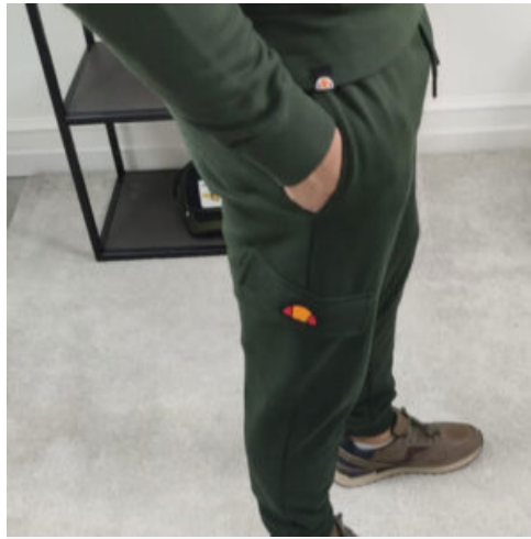
PANTALONE UOMO IN TUTA ELLESSE - RIF. AA951