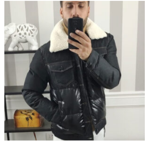
GIUBBINO UOMO - RIF. AA890