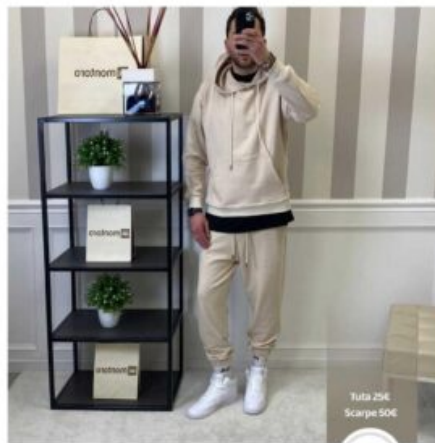
TUTA UOMO - RIF. AA448