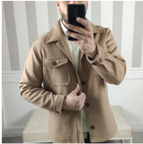
GIACCA UOMO OVER-D - RIF. AA966